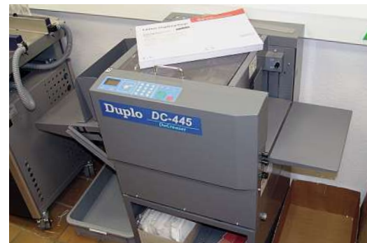
Nach der Drupa 2008 hielten die vollautomatische Balkenrillmaschine FKS/Duplo DuCreaser DC-445 (l.) und die Broschürenfertigung FKS/Duplo Digital System 5000 mit 2-Stationen-Digitalbogenanleger bei Digi Print Einzug.